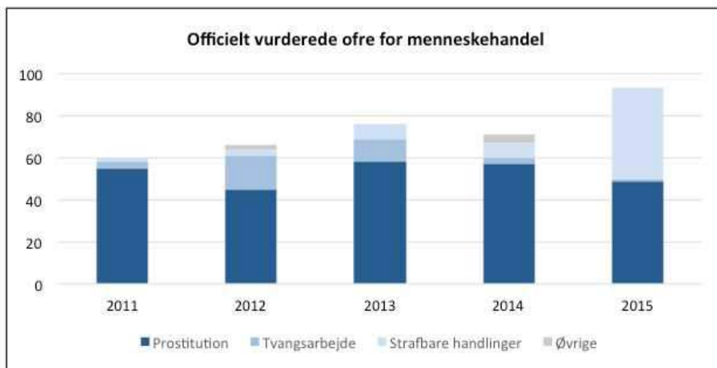
Figur 1. Officielt vurderede ofre for menneskehandel fordelt på udnyttelsesform

Figur 1 viser antallet af officielt vurderede ofre for menneskehandel i Danmark fra 2011 til 2015 fordelt på udnyttelsesform. Som det fremgår af figuren, har der i 2015 været en markant stigning i antallet af ofre for menneskehandel, hvilket skyldes den såkaldte Hvepsebosag , hvor 35 rumænske mænd og 2 kvinder i 2015 blev vurderet som ofre for menneskehandel til kriminalitet (strafbare handlinger).